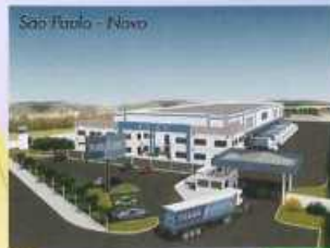
São Paulo - Novo