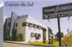
Caxias do Sul