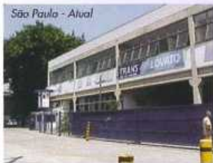
São Paulo - Alval