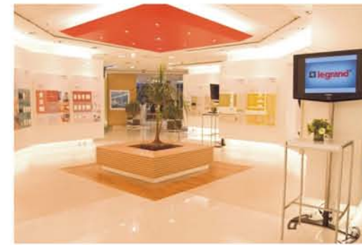
INNOVAL LEGRAND BRASIL Centro de Treinamento e Show Room

Presente em mais de 160 países, o Grupo Legrand no Brasil está consolidado por marcas de referência mundial e regional como BTicino, Cablofil, Cemar Legrand, HDL, Pial Legrand, Lorenzetti e Ortronics.