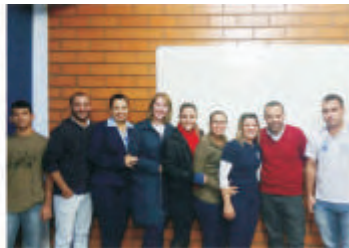
Treinamento Atendimento ao Cliente - Joinville - SC