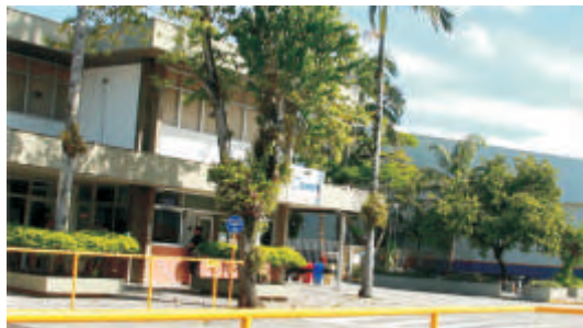
Unidade da Cremer em Blumenau - SC

A Cremer é uma empresa genuinamente brasileira, fundada na década de 30, focada na produção e desenvolvimento de soluções para segmento hospitalar, tendo como abrangência todo Brasil e Mercosul na distribuição de seus produtos.