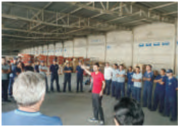
Palestra SIPAT - Itajaí - SC