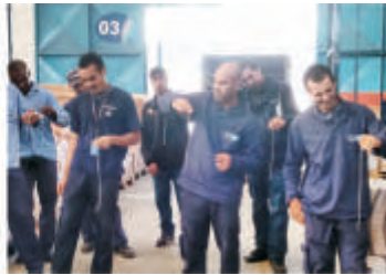
SIMDI - Florianópolis - SC