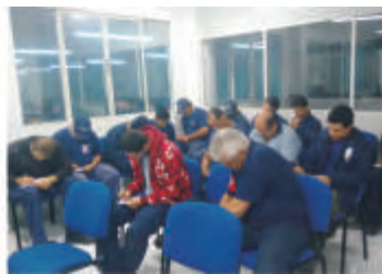
Treinamento Operacional - Florianópolis - SC