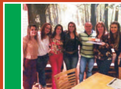
Equipe Comercial Joinville, vencedora do grupo verde.