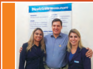
Equipe Comercial Ribeirão Preto, vencedora do grupo laranja.