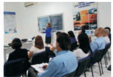
Workshop sobre Utilização Fiscal aplicada às Operações de Transporte - Porto Alegre - RS

Só quem entende os seus negócios pode entregar mais eficiência e rentabilidade.