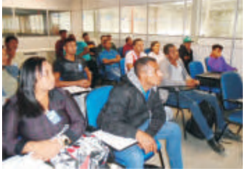
Integração - Belo Horizonte - MG

Utilizando a criatividade, com foco no desenvolvimento profissional e pessoal, segue imagens de alguns treinamentos realizados com as equipes das áreas administrativa, comercial e operacional.