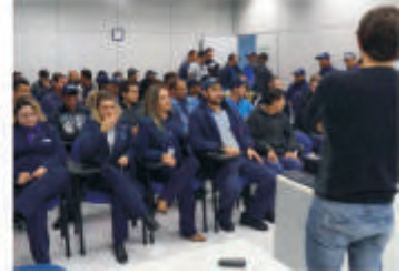
Palestra SIPAT - Curitiba-PR