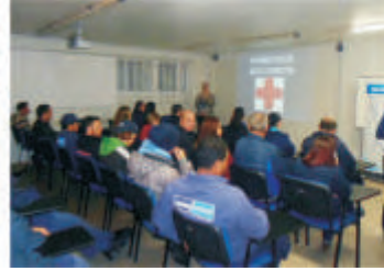
Palestra SIPAT - Caxias do Sul - RS