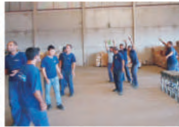
SIMDI - Londrina - PR