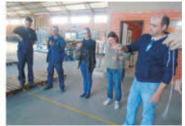
SIMDI - Santa Maria - RS