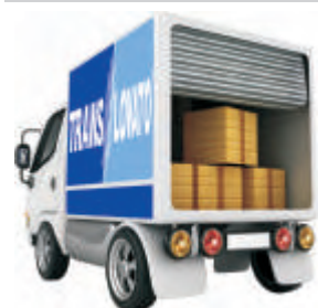
DESCARGA E RECONFERÊNCIA COM LEITOR ÓTICO

É importante ressaltar que, em determinadas regiões do país como, por exemplo, São Paulo, é necessário adequar a passagem/chegada dos veículos em horários sem restrições de rodagem, este fator também influencia no tempo da transferência. Em uma ação em conjunto com os motoristas, estas questões são levantadas para definir os horários de saídas e chegadas.