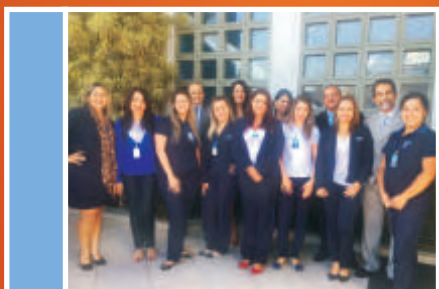
Equipe Comercial São Paulo, vencedora do grupo azul.