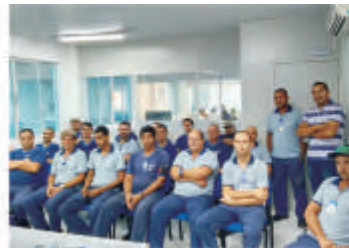
Treinamento Avarias como Evitar - Florianópolis - SC