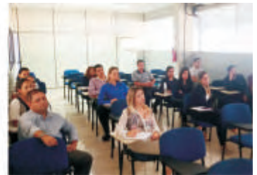
Treinamento Diretrizes Organizacionais - Campinas - SP