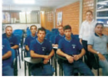
Integração - Blumenau - SC