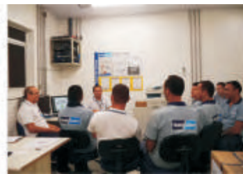
Treinamento Operacional - Sobral - CE