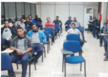
Treinamento Operacional - Campinas - SP