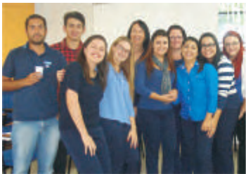
Treinamento Atendimento ao Cliente - Caxias do Sul - RS