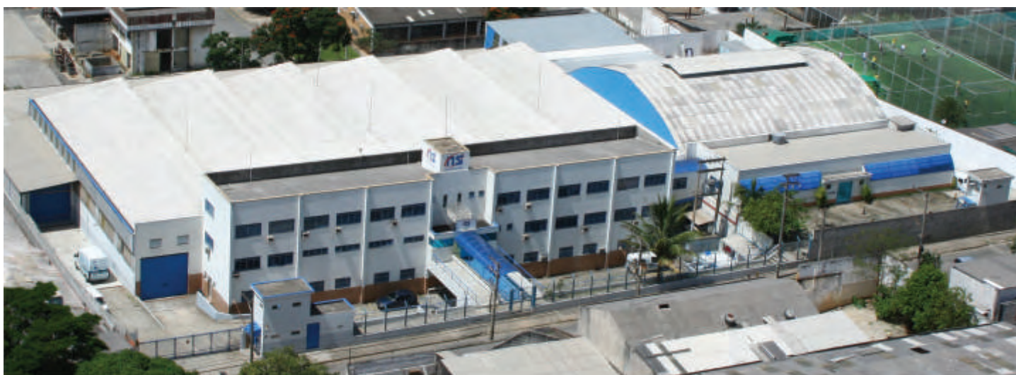
Sede da Omron - NS em São Paulo

F undada em 1969, a NS Indústria de Aparelhos Médicos foi responsável pela introdução, no Brasil, do primeiro inalador de uso doméstico portátil acionado por compressor. Essa inovação possibilitou às pessoas, sob orientação médica, fazerem inalação de rotina, em casa ou no hospital. Com o passar do tempo, sempre focada no desenvolvimento de produtos voltados para a saúde, a NS impulsionou seu crescimento investindo em tecnologia, aperfeiçoamento e ampliação de sua linha de produtos, contando com um mix composto por inaladores a ar comprimido e ultrassônicos, umidificadores de ambientes, micronebulizadores e acessórios para inalação, aspiradores cirúrgicos e higienizadores de escova dental.